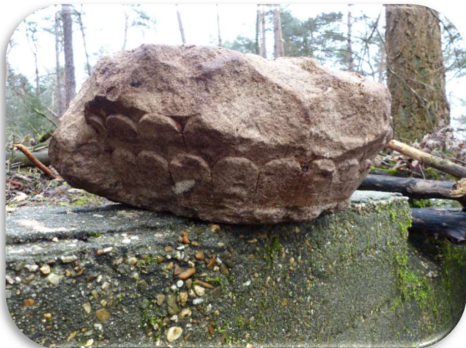
Door studenten werd een kalkzandsteen ornament gevonden.

Vermoedelijk achtergelaten bijvangst van de “schatzoekers”. Hier gaat het waarschijnlijk om een oud “kapiteel”. Op advies van de begeleider van de studenten hebben we de steen meteen veilig gesteld. Inmiddels is het kapiteel bekeken door deskundigen van de archeologische werkgroep Venray en de archeoloog van de gemeente Venlo. We wachten in spanning af wat uit het onderzoek gaat komen.