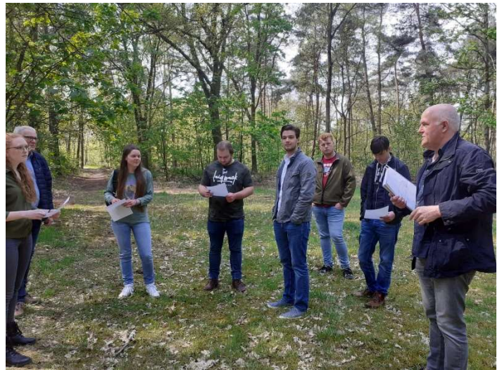
Met de studenten tijdens de rondleiding op het NAD kamp Endepoel

Donderdag 13 mei mochten we de studenten andermaal verwelkomen op het NAD kamp. In de ochtend hebben we het kamp verkend en hebben we uitleg gegeven over de werkzaamheden die we reeds hebben uitgevoerd zoals de begaanbaar gemaakte paden en de barakken die inmiddels zijn vrij gegraven.