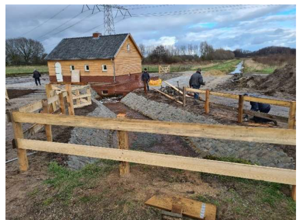
De volmolen langs de Loobek.

Het zal u niet zijn ontgaan dat de Stichting Loobek aan het begin van de Loobek doende is met de bouw van een "volmolen". Op het moment dat 't Raakeliezer bezig is de historie van het arbeidskamp in de Endepoel te onderzoeken is er aan de andere kant van ons dorp een andere activiteit gaande die weer een ander deel van de geschiedenis van deze streek in volle glorie terugbrengt door de bouw van een volmolen. Dit project nadert zijn voltooiing en wordt uitgevoerd door vele enthousiaste vrijwilligers uit onder andere Merselo. Wat is nu een volmolen? De volmolen werd eeuwen geleden gebruikt voor de productie van vilt. De wol van de schapen die in de Peel graasden werd deels verhandeld, gesponnen, geweven en veredeld tot vilt. Het maken van vilt gebeurde in een volmolen. De wol werd er met door waterkracht aangedreven houten hamers urenlang geplet waardoor vilt ontstond, dat gebruikt werd voor kleding. Omdat bij dit proces onder meer urine gebruikt werd stonk een volmolen dan ook een uur in de wind en stond hij meestal buiten de dorpsgrenzen. De volmolen die op Weverslo gebouwd is zal aangedreven worden door water van de Loobek en is bij de plek met het grootste verval gerealiseerd. Na voltooiing zal de molen ook ingezet worden voor demonstraties en educatie doeleinden. Zeker een bezoek waard in combinatie met een wandeling langs de Loobek.