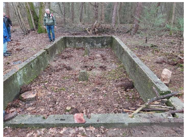
Studenten bij het wachthuisje

Half maart hebben ook de studenten van de Saxion Hogeschool op eigen gelegenheid een bezoek gebracht aan het kamp. Zij zijn bezig met een afstudeeropdracht voor hun studie Conflict Archeologie. Ter plekke hebben ze een indruk kunnen krijgen van de omvang van het kamp en hoe de indeling was.